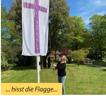
... hisst die Flagge...