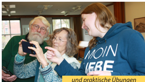
und praktische Übungen