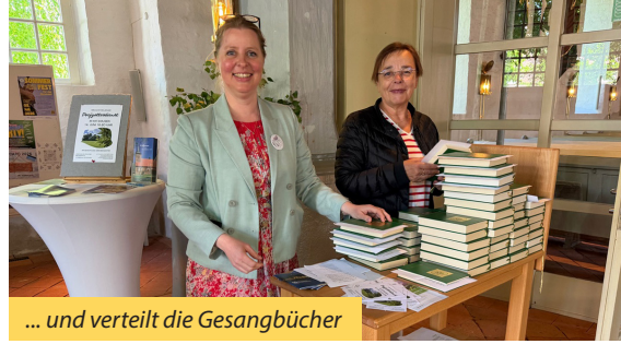
... und verteilt die Gesangsbücher

geschmückte Altar, der gestaltete Vorraum, das Läuten der Glocken, die ausgehändigten Gesangsbücher, all das ist zu sehen und zu hören. Weniger im Blick sind die Außenbereiche. Es wächst und wuchert überall. Die Pflege des Geländes um die Kirche und der Pastoratsgarten gehören also auch dazu. Sie erfordern gärtnerisches Wissen, Umgang mit unterschiedlichem technischen Gerät und auch Kraft und Ausdauer. Da habe ich schnell dazulernen dürfen und zum Glück auch Hilfe und gute Tipps bekommen.