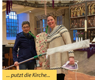
... putzt die Kirche...