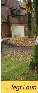
... fegt Laub.