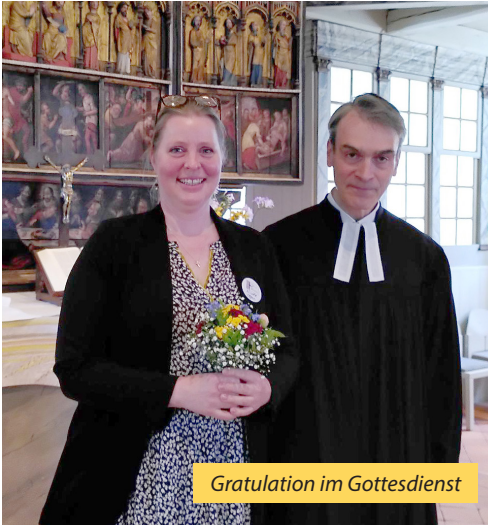
Gratulation im Gottesdienst