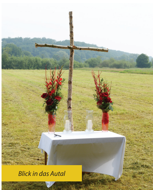
Blick in das Autil