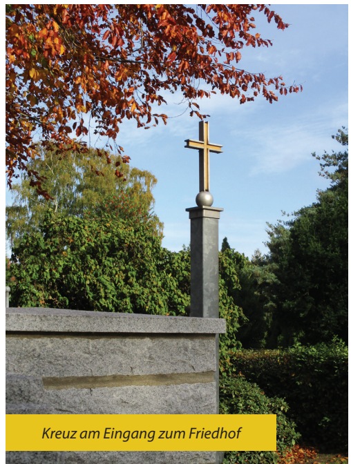
Kreuz am Eingang zum Friedhof

Petra Fenske, Vors. des Friedhofsausschusses