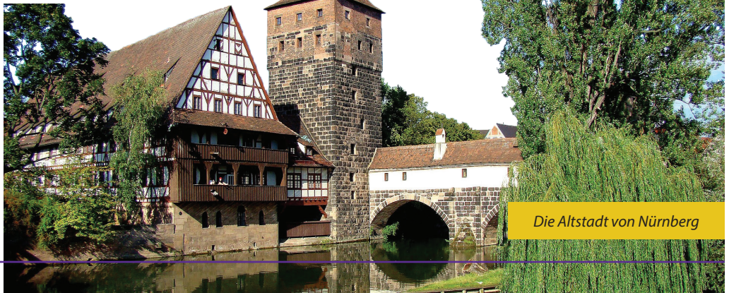
Die Altstadt von Nürnberg

Lust? Kein Problem! Die Anmeldungen und den Flyer findest du auf unserer Homepage zum Download. Ausfüllen, abgeben, teilnehmen und leiten lernen!