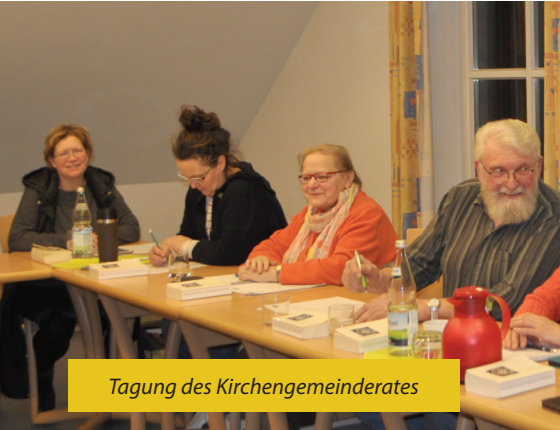
Tagung des Kirchengemeinderates