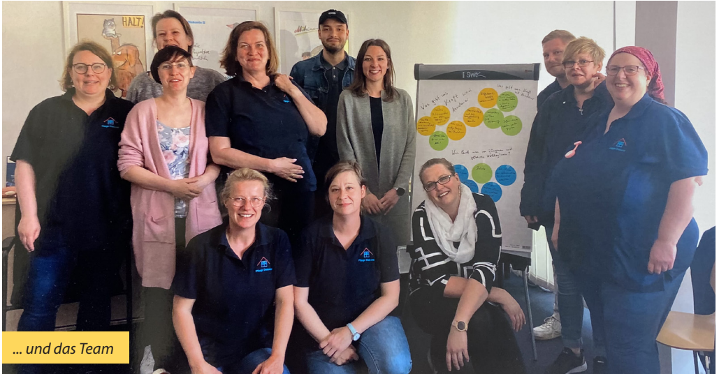
... und das Team

ten eingesetzt werden können. Frau Reiser erläutert, dass die Pflege Diakonie Bad Bramstedt einer von 21 Standorten in Altholstein und vorrangig im ambulanten Bereich tätig ist. Eine Tagespflege, um Menschen so lange wie möglich das Leben in den eigenen vier Wänden zu erhalten, betreutes Wohnen oder eine Wohngemeinschaft für Menschen mit Demenzerkrankung gibt es in Neumünster, Kaltenkirchen